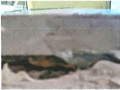
Foto fra under hjørnet i nr. 22